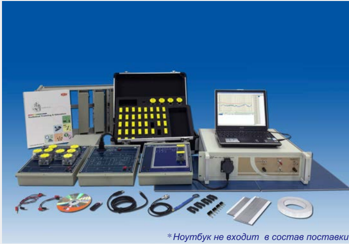
* Ноутбук не входит в состав поставки

Система EMC-100 состоит из двух частей : одна - это измерительный прибор, оснащенный функцией измерения электромагнитных помех (EMI), в том числе кондуктивных и индуктивных электромагнитных помех. Он обеспечивает контроль электромагнитных помех продуктов перед проверкой. Вторая часть - это учебные модули, которые обеспечивают для учащихся простоту выполнения экспериментов и изучение базовых принципов электромагнитных помех и их подавления как метода борьбы с ними. Новички могут изучить теорию электромагнитных помех, а также методы измерения и подавления, которые применяют специалисты по электромагнитной совместимости.