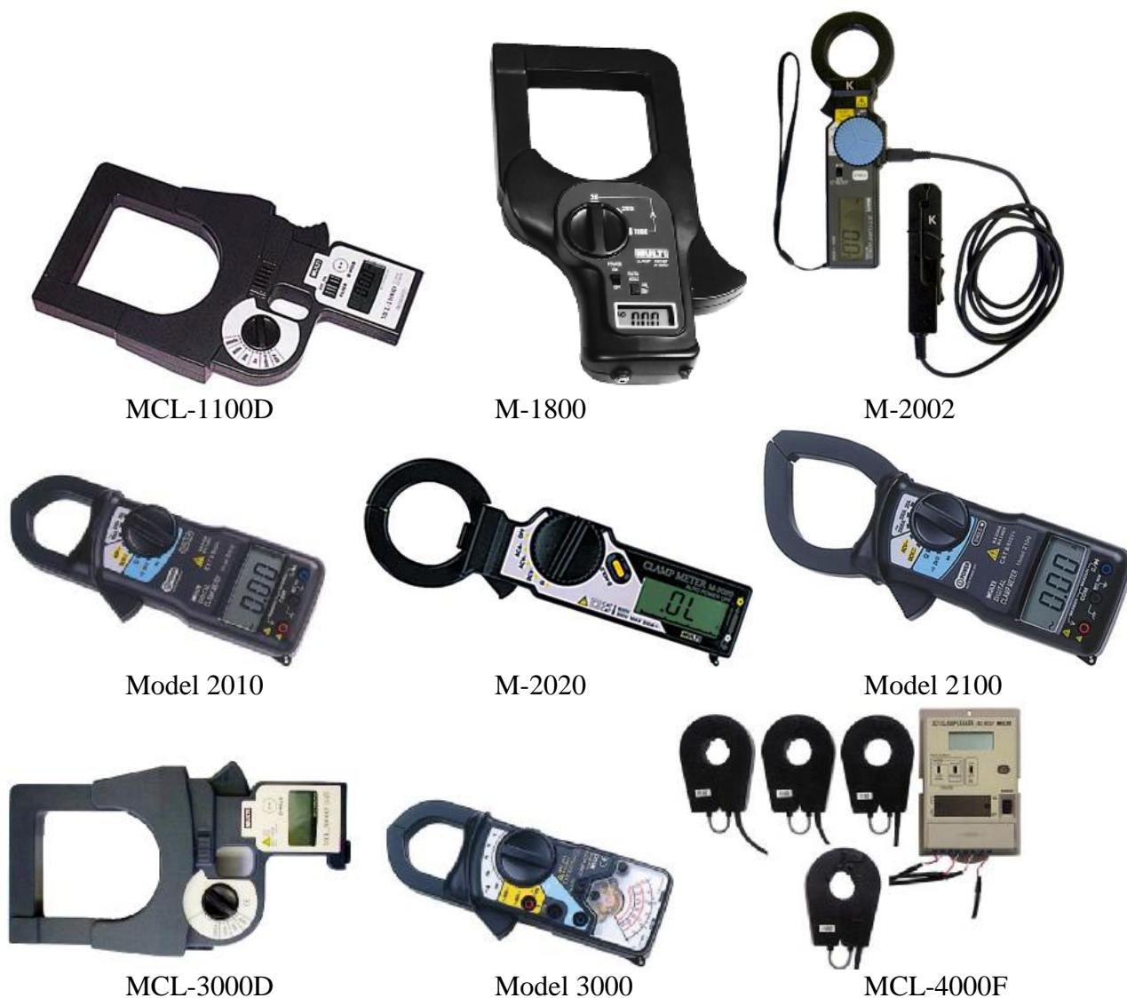
Рисунок 1 - Фотографии общего вида клещей