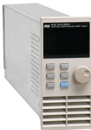
АКИП-1382/4 (модуль для установки в шасси)