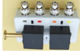
Адаптер подключения 1012 (1014)

* Примечание: при установке переключателя в положения А или В - опции могут быть использованы с измерителями RLC и анализаторами компонентов WK в соответствии с нижеуказанной таблицей совместимости: