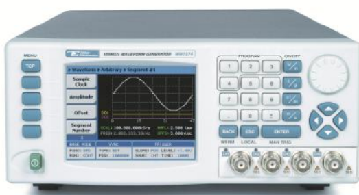
WW5064, WW1074, WW2074

Генераторы применяются в лабораторных условиях при исследованиях, настройке и испытаниях систем и приборов, используемых в радиоэлектронике, связи, автоматике, вычислительной и измерительной технике, приборостроении, машиностроении, геофизике, биофизике.