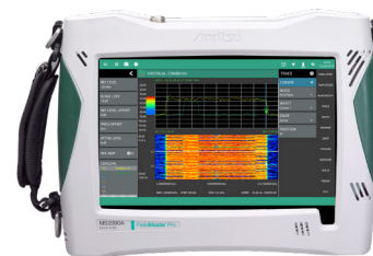
Field Master Pro MS2090A