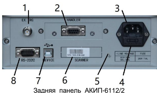
Задняя панель АКИП-6112/2

Parameters described above are combined in the following modes: